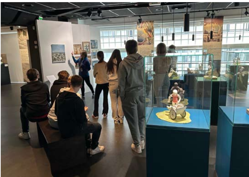
9F Museo Skogsterilla

Kulttuuripolku on osa Hämeenlinnan kaupungin perusopetuksen opetussuunnitelmaa. Tämä kulttuurikasvatusohjelma on kaikkia kouluja velvoittava. Kulttuuripolun toimintaa organisoii Verkatehtaalle sijoittuva Kulttuurikeskus Arx.