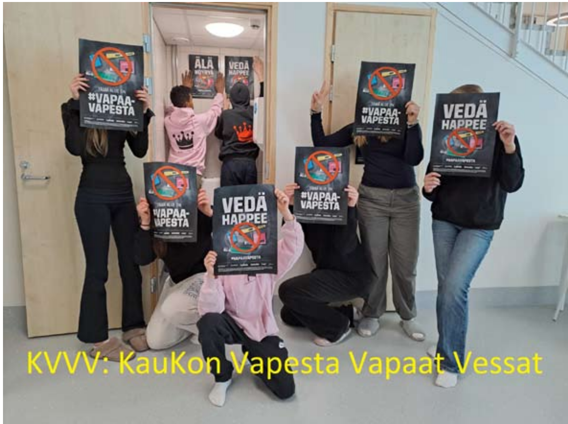
Muotivillitykset tulevat ja menevät. Trendinä laskussa on nyt vaped