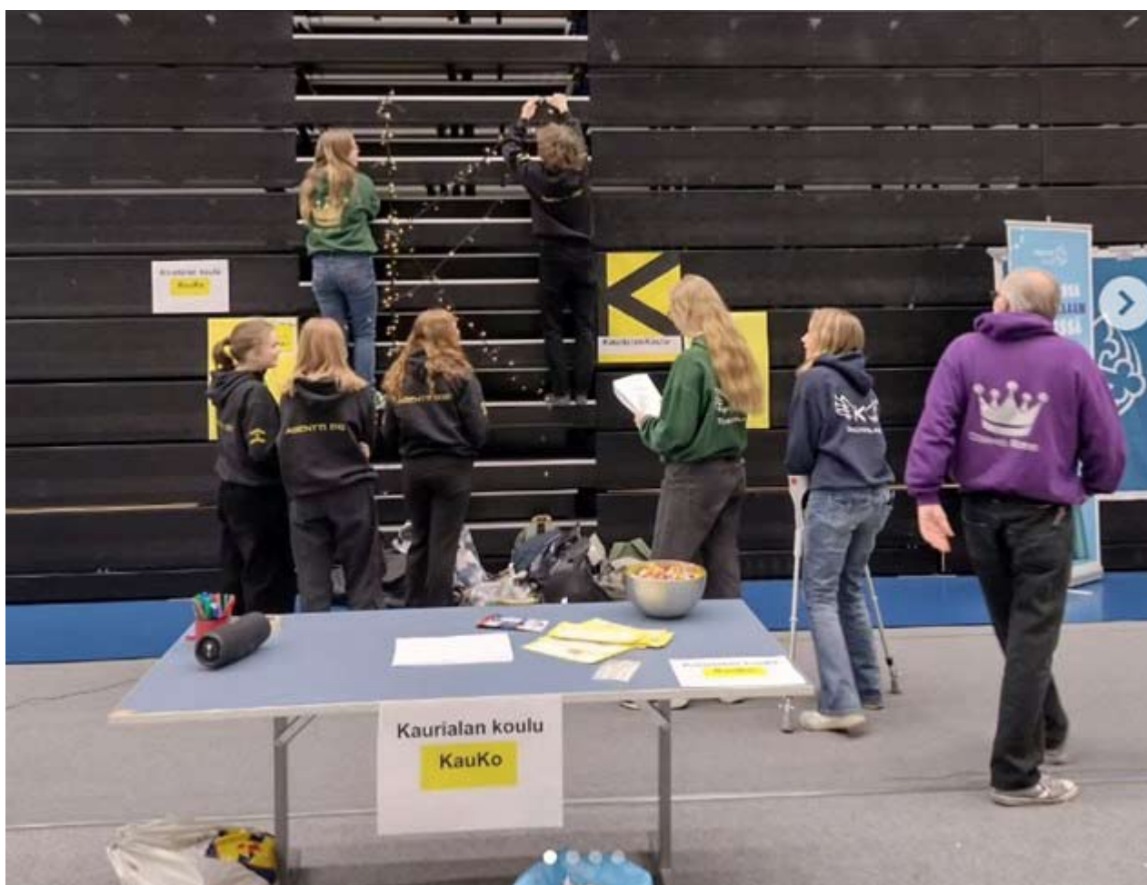
Ei seinillä kiipeileviä karhuja yläkoulumessuilla. Ei foliohattuja eikä onnenpyöriä, kuten muilla. KauKon standilla tulevat yläkoululaiset saivat miettiä, mikä muuttuu ja kannattaako muutoksia turhaan jännittää